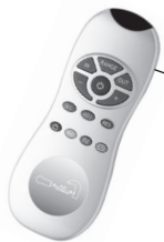
060967A Remote Control Télécommande Control remoto

When using the remote to adjust the flush time, do not exceed the local codes and regulations for flush volume. Lorsque la télécommande est utilisée pour ajuster la durée de chasse, la consommation d'eau doit respecter les codes et les réglementations locaux. Al usar el control remoto para ajustar el tiempo de la descarga, no exceda las normas y regulaciones locales acerca de la cantidad de agua.