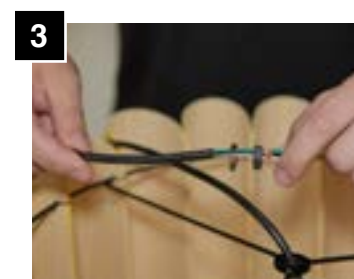
3 Pass lock washer and nut through cable.