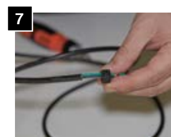
7 Feed additional strain relief through cord.