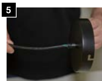
5 Feed cord through canopy.