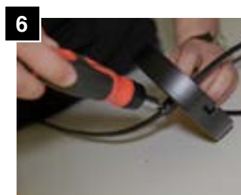
6 After adjusting cord length, tighten set screw on canopy.