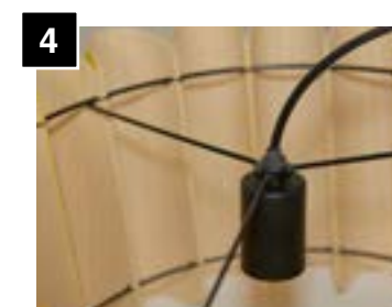
4 Firmly tighten socket to shade ring.