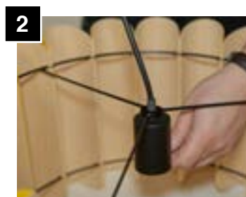
2 Pull cord until socket bottoms out.