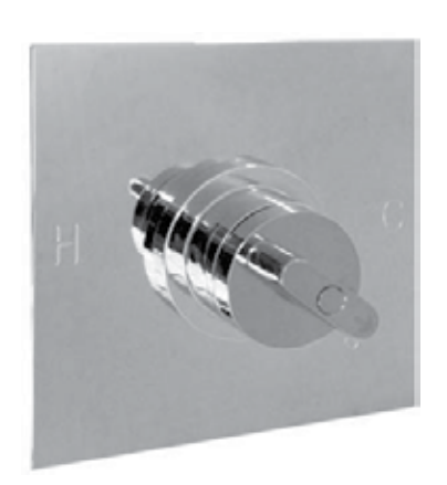
MIRWH34700 PRESSURE BALANCED TRIM LESS DIVERTER